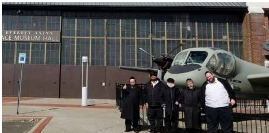
ביים עיר ענד ספעיס מוזעאום