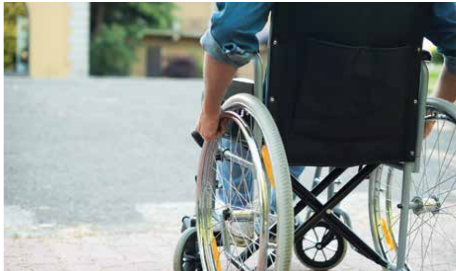
די נייע שאצונג איבער עס.עס. זענען א דאנק בעסערע דיאגנאזן

דאס קומט אין א צייט וואס צוויי רעוואלוציאנערישע רפואות פאר עס.עס. האלטן יעצט אינמיטן די פראבעס, ווי באריכטעט אינעם פאריגן גאזעט. די קאמבינאציע פון בעסערע דיאגנאזן און מעגליכע רפואה איז ווי א שייך פון האפענונג פאר די מיליאנען וועלכע ליידן פון דעם מחלה, און קוקן ארויס אויף דעם טאג ווען עס וועט זיין א געהעריגע רפואה אי"ה.