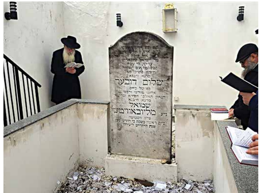
דעם ציון פונעם רש"ב אין שטאט ראסטאו