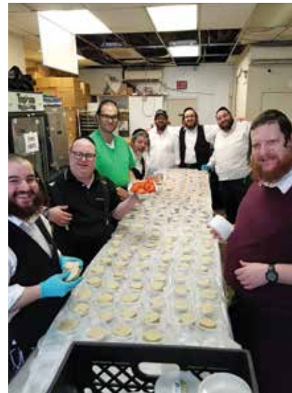
ביים העלפן דעם "ייד אפרים" חסד ארגאנאזאציע