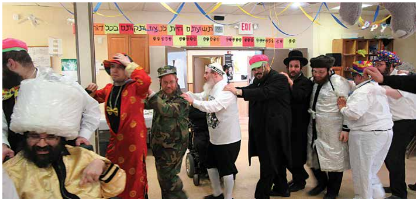
ריקודין של מצוה... ליהודים הייתה אורה ושמחה וששון ויקר...