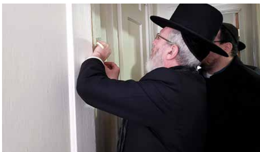
אשר קדשנו במצותיו וצונו לקבע מזוזה... ביים אנקלאפן א מזוזה

דער אויסטערלישער סוקסעס פון נאך א אינדיווידועלער היים ברענגט באנייטע אינטערעסע צו צושטעלן דעם זעלבן סערוויס פאר נאך אינדיווידועלן וועלכע קענען זיין בארעכטיגט דערצו, און אין די קארידארן פון המספיק אוו קינגס קאונטי ווערן שוין אויסגעארבעט נאך פלענער פאר אזעלכע דירות אין די צוקונפט, און מען ארבעט מיט די פארשידענע שטאטישע אגענטורן צו צושטעלן דעם זעלבן סערוויס פאר נאך וועלכע נויטיגן זיך דערין. ★