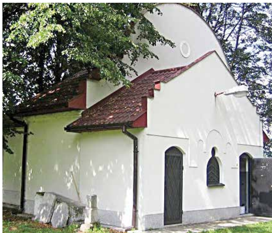
דער אהל פונעם צאנזער רב זצוק"ל און די קינדער

אמאל פורים ביים טיש איז דער הייליגער דברי חיים געווען שטארק פאר'דביקות'ט, און דער עולם איז געווען בשמחה. איינער פון די חסידים איז ארויף אויפ'ן טיש, און