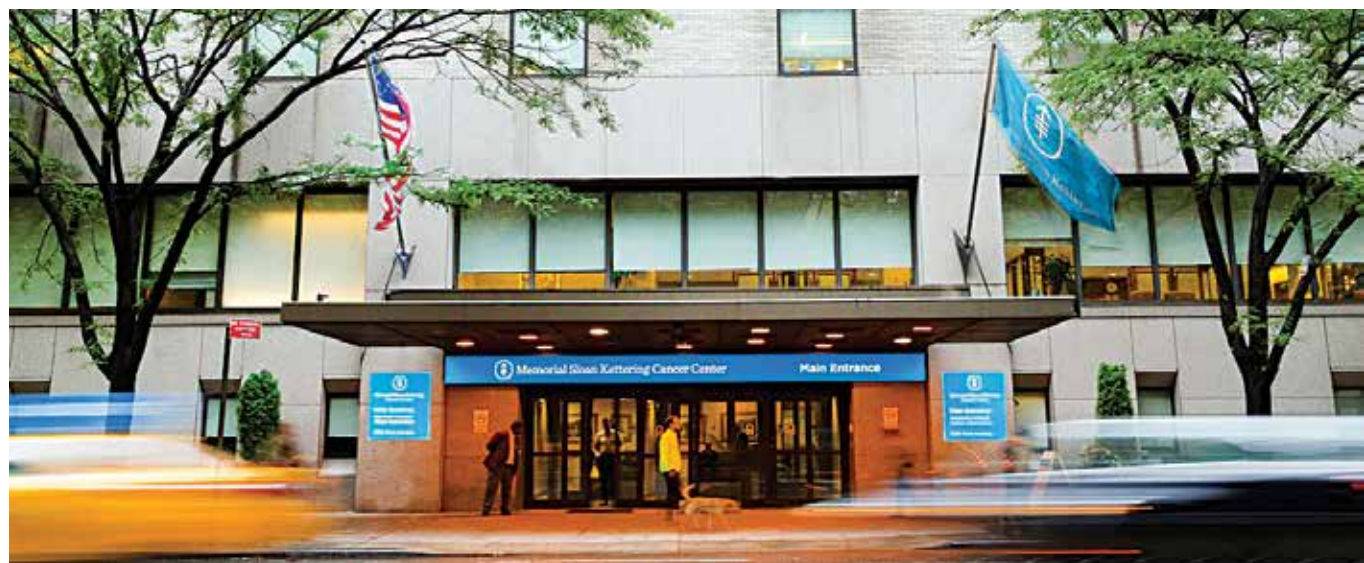
עטליכע פירער פון מעמאריאל שפיטאל (אין בילד) האבן זיך אפגעזאגט פון זייערע פאזיציעס אין דראג פירמעס

אויף צו אדרעסירן די זארגן איבער'ן צוקונפט האבן זיך עטליכע פירער אפגעזאגט פון זייערע פאזיציעס אין די דראג פירמעס, און עס איז אונטערגענומען געווארן א רעאלאזציע וועלכע וועט פארבאטן פאר מיטגלידער אין די פירערשאפט פונעם שפיטאל צו דינען אויך אין די פירערשאפט פון מעדיצינישע פירמעס. ★