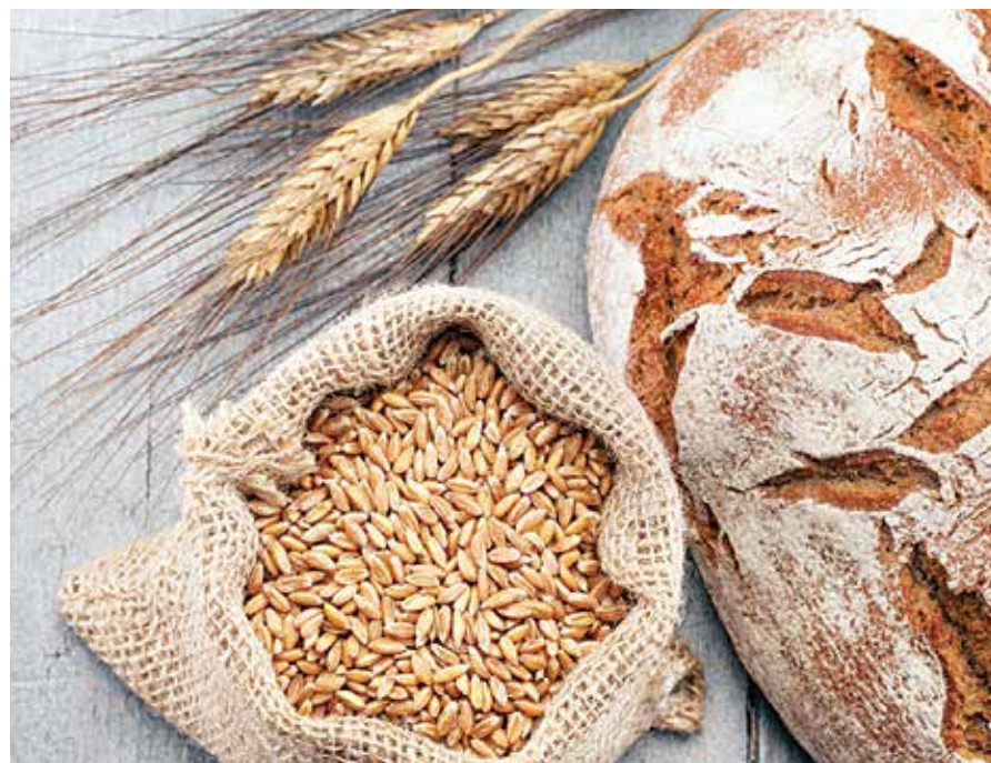
גאנצע קערנדלעך פארמאגן געזונטערע באשטאנדטיילן

דער ערקלערונג דערויף - לויט די פארשער - איז וויבאלד דאס געברויכן אסאך האול גרעינס אין די טעגליכע דיעטע רעדוצירט אינסולין אומבאלאנס און אנצינדונג, וויבאלד עס פארמאגט אין זיך די באשטאנדטיילן