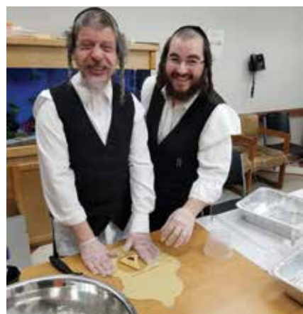
ביים באקן המן טאשן פאר משלוח מנות