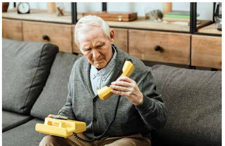
נייער טעסט וועט דיאגנאזירן אלצהיימער אין אן "אויגנבליק"

די וועלט'ס פאפולאציע עלטערט זיך שנעלער ווי ערווארטעט און די צאל פאציענטן מיט אלצהיימערס שטייגן