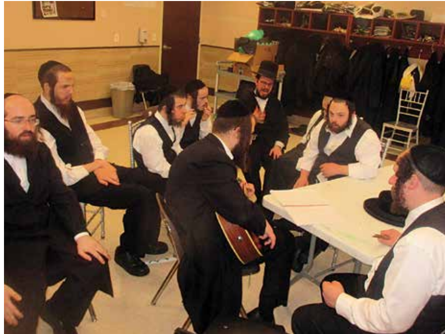
א מוזיקאלישע פארברענג לכבוד חודש אדר