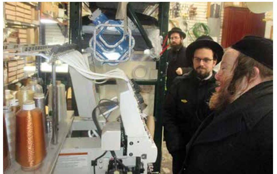
תלמידים כאפן א נענטערע בליק אויף די פראדוקציע פון תשמישי קדושה

אהערגעשטעלט מקיים צו זיין דעם "זה קלי ואנהו" און אהערשטעלן הערליכע קונסטליכע תשמישי קדושה. פאר'ן אהיימפארן האבן אלע תלמידים באזוכט אינעם ספרים אפטיילונג וואו יעדער איינער האט באקומען א פערזענליכע מתנה, און דערמיט געשלאסן אן אינהאלטסרייכע און געשמאקע טאג ווען זיי האבן זיך אנגעהויפט מיט ידיעות און באקומען א געשמאק צו ווייטער שטייגן און מסיים זיין אלע ל"ט מלאכות און זיך איינקויפן די ידיעות אין הלכות שבת. ★