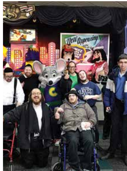
א באזוך אינגעם טשאק-אי-טשיז