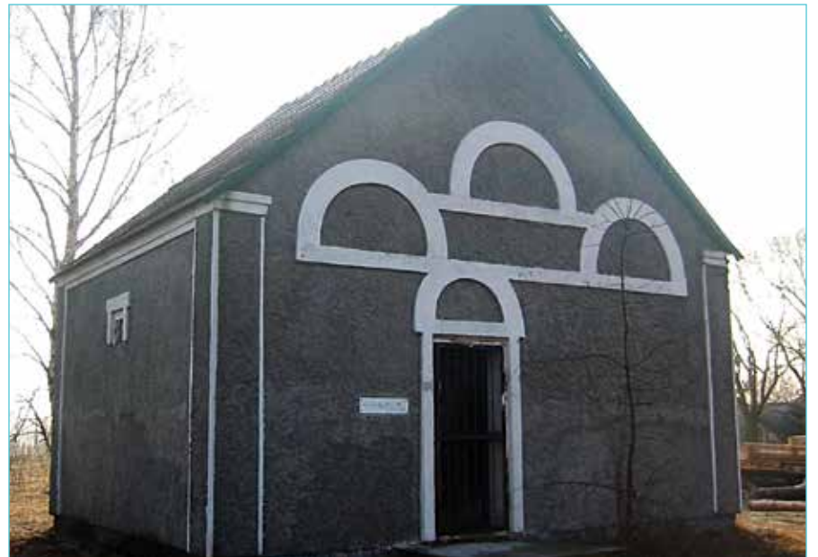
דער אהל פון הצדיקים לבית געשכיז

געעפנט דאס לעדל און אנגעגאסן א גלאז פאר'ן איד און באפוילן קידוש צו מאכן. דער איד, כאטש זיינע כוחות האבן זיך אים כמעט אויסגעלאזט, האט ער זיך פארט געשעמט צו מאכן קידוש אינמיטן דאווענען און נאך אויפ'ן באלעמער פארנט פון גאנצן עולם, האט ר' מרדכי'לע שנעל גענומען דאס בעכער'ל, געזאגט 'תקעו בחודש'... און געמאכט קידוש כדי דער איד זאל עסן און טרונקען און זיך דערמונטערן דאס הארץ. הערשט נאכדעם איז דער צדיק צוריק צו זיין פלאץ ענדיגן דאס דאווענען. נאכ'ן דאווענען האט ער צוגערופן דעם שמש ר' נחמן און אים געזאגט, "ווי קען דאס זיין אז א איד איז אפגעשוואכט דאס הארץ און דו האסט נישט רחמנות אויף אים? ווען איך האב געזען זיין צער און רחמנות געהאט אויף אים און הערשט דערנאך ווייטער געדאוונט, בין איך זיכער אז פונקט ווי איך האב רחמנות געהאט אויף דעם איד, וועט דער באשעפער רחמנות האבן אויף אונז און גאנץ כלל ישראל!" רבי מרדכי בן רבי דוב בער (שפירא) זצ"ל, רשפי אש, ח' ניסן תק"ס