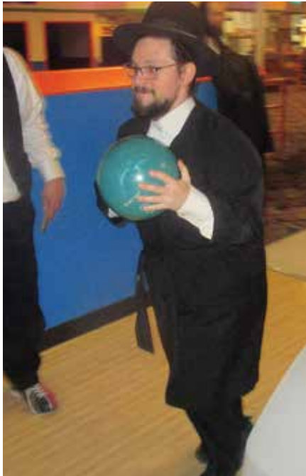
מ'טרעפט אין ציל