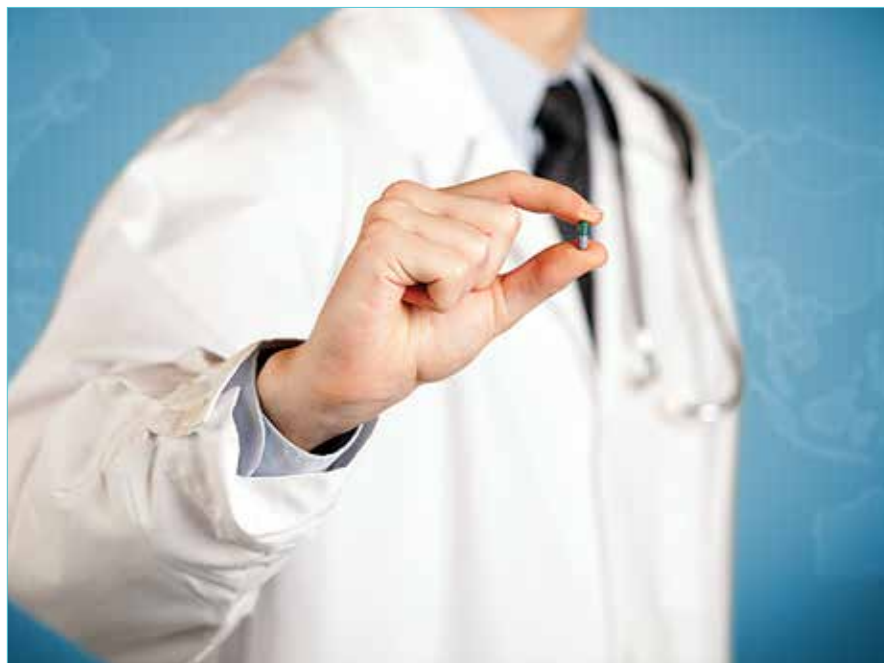
2.6 מיליאן מענטשן האבן באקומען אומזיסט אנטיביאטיק

»זייט 36 געווארן 206 מיליאן אנטיביאטיק פארשריפטן דורכאויס דעם יאר, און ארום 2.6 מיליאן מענטשן האבן באקומען אומזיסט אנטיביאטיק טראץ וואס עס האט זיך נישט אויסגעפעלט. "דאס פארשרייבן אנטיביאטיק אן קיין באגרעניצונגען טוט בייטשייערן צום אויפשטייג פון פרישע אינפעקציעס וועלכע קענען נישט באהאנדלט ווערן מיט אנטיביאטיק" זאגט דער באריכט, און לייגט צו אז די צאל אנצינדונגען און ווירוסן וועלכע זענען שטאנדהאפטע קעגן אנטיביאטיק האלט אין איין שטייגן.