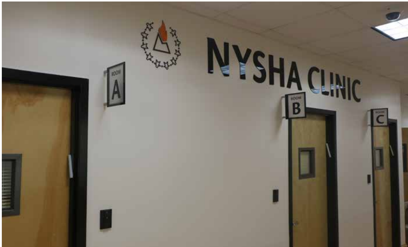
שניתן רשות לרופא די אריינגענו צו די פראכטפולע טעראפי צימערן

אבער אויסער דעם טוט דאס ערלויבן צו אויסברייטערן די סערוויסעס אויך פאר יעדער ניו יארקער איינוואוינער וועלכער איז לעגאל בארעכטיגט צו די בענעפיטן וואס ניו יארק שטעלט צו פאר מענטשן מיט ספעציעלע געברויכן. די שטאב פון געטרייע נייש"א מיטגלידער העלפן יעדן איינעם מיט די נויטיגע לעגאליטעטן צו איבערקוקן אויב מען איז בארעכטיגט צו די סערוויסעס, און אויב יא וועלן זיי העלפן ווערן באשטעטיגט און פארזיכערן אז די סערוויסעס ווערן צוגעשטעלט על צד היותר טוב.