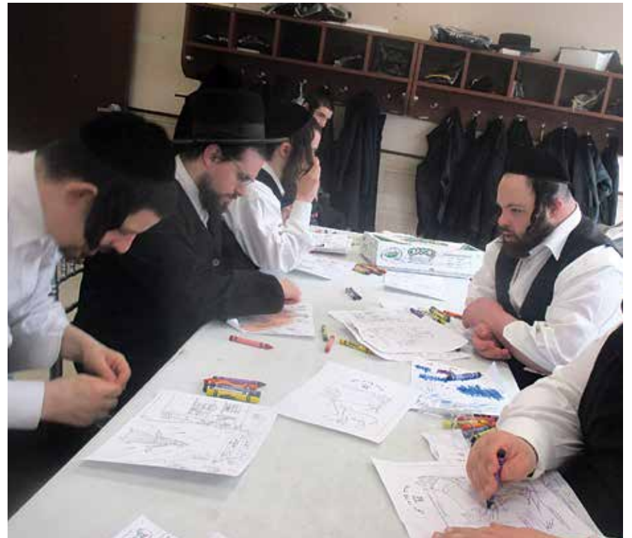
ביים ערצייגן הערליכע האנט ארבעט