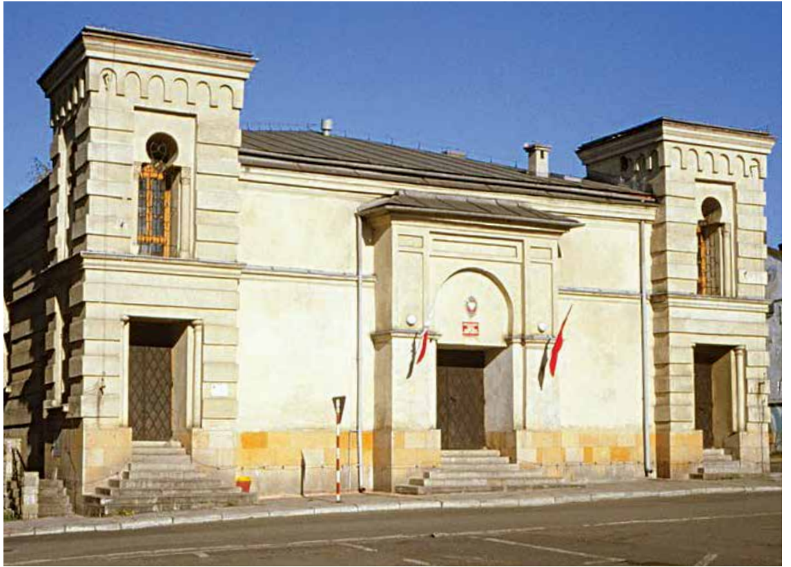
דער שטאטישער בית המדרש אין צאנז וואס איז לעצטנס באנייט געווארן להחזיר עטרה ליושנה

וועסטו האבן אמונה וועסטו געהאלפן ווערן, און איך בין נישט ערגער פון יאקאב! איך קען אויך בעטן." ווען מיין טאטע איז אנגעקומען אין שטאט האט דער דאקטער אפגעווארט מיין טאטן צו מאכן דעם אפעראציע, האט מיין טאטן דערציילט די גאנצע מעשה מיטן רבין אז ער איז נישט מסכים צו מאכן די אפעראציע. האט דער דאקטער זיך אויפגערגעט און געזאגט אויב עפעס וועט געשען צום קינד, וועט ער זיך מעלדן צו די פאליציי אז די טאטע איז געווען שולדיג אין דעם טויט! אבער אויב ער ווערט אויסגעהיילט אן א אפעראציע ווערט ער א בעל תשובה! מיין טאטע האט זיך נישט דערשראקן ווייל ער האט געהערט קלארע רייד פון רבין און געהאט אמונה אין צדיק. עס איז אריבער צוויי טעג ווען פלוצלונג האט עס אנגעהויבן קראצן ביים הארץ פון דער חולה און ער האט זיך געקראצט ביז די וואונד וואס איז געווען אויפן הארץ האט זיך געעפענט. ווען מען איז געגאנגען צום דאקטער האט ער געזאגט אז דאס איז געווען די רפואה פארן מחלה און יעצט וועט דאס קינד זיך אויסהיילן און אים געגעבן די ריכטיגער מעדיצין און דער אינגעל האט געלעבט ביז די מלחמה. און דער דאקטער איז געווארן א בעל תשובה. רבי חיים בן רבי ארי' לייבוש הלברשטאם זצ"ל, דברי חיים עה"ת שו"ת ועוד, כ"ה ניסן תרל"ז