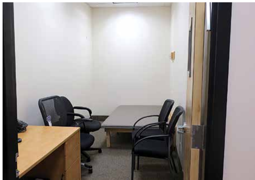
אינעם פון די שפאגל נייע צוגעלייגטע צימערן אינעם קליניק

דאס אהערשטעלן אזא ברייטע און גאסטפריינטליכע לאקאל אין צענטער פון מאנסי שטרייכט אונטער די שטרעבונג פון נייש"א צו אויסברייטערן אירע סערוויס פאר יעדן ניו יארקער וועלכער דארף צוקומען דערצו, און זי שטעלט א פרישע ניווא אין די הויכע קוואליטעט פון סערוויס וועלכע שטייט ארויס אינעם פעלד. ★