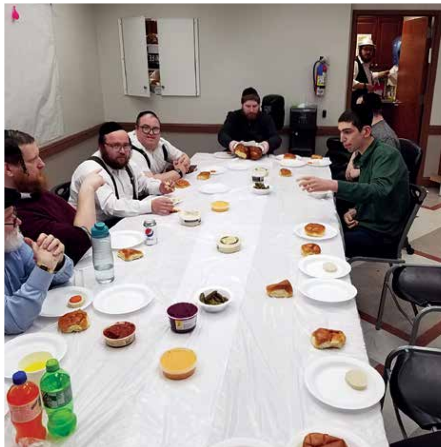
תלמידים אין המספיק - קינגס וואשן זיך צום סעודת ראש חודש