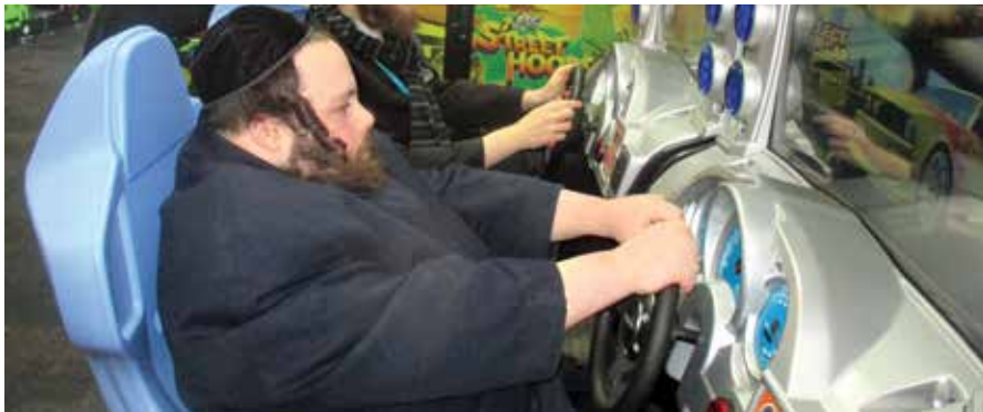
מען פירט א רעדל...