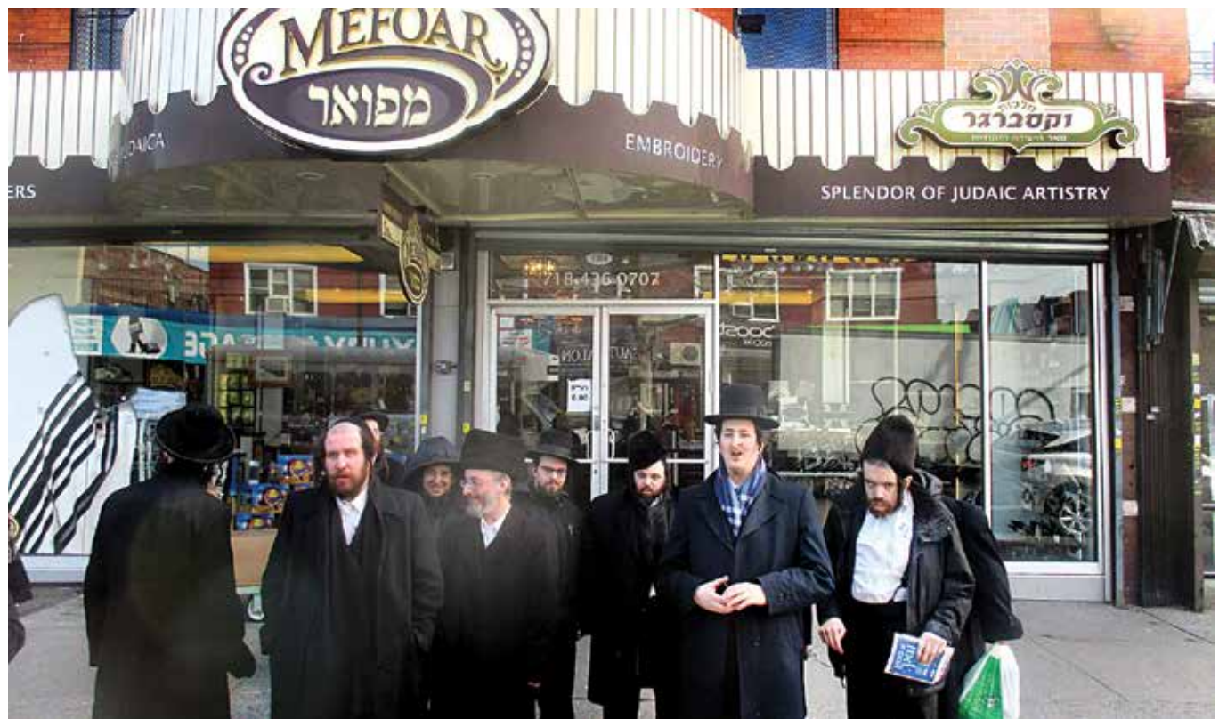
תלמוד מביא לידי מעשה די תלמידים נאכ'ן זיך באקענען פון די נאנט מיט'ן פראצעדור פון מאכן טליתים

אין די ראמען פון ישיבה תורה וחסד אינעם המספיק דעי-העב אוו ארענדזש קאונטי ווערט געלייגט א ספעציעלן דגוש אז די תלמידים זאלן קונה זיין ידיעות התורה מיט א געשמאק און א זיסקייט, און אין די זעלבע צייט זאלן זיי אנטוויקלן זייערע אייגענשאפטן און מעגליכקייטן, דעריבער זוכן די מגידי שיעור יעדע געלעגנהייט צו צוזאמענשטעלן די צוויי און אראנזשירן פראגראמען וועלכע פלאנצן אין אין די תלמידים ידיעות התורה און גלייכצייטיג זיך איינקויפן באהאוונטקייט און פארשידנארטיגע