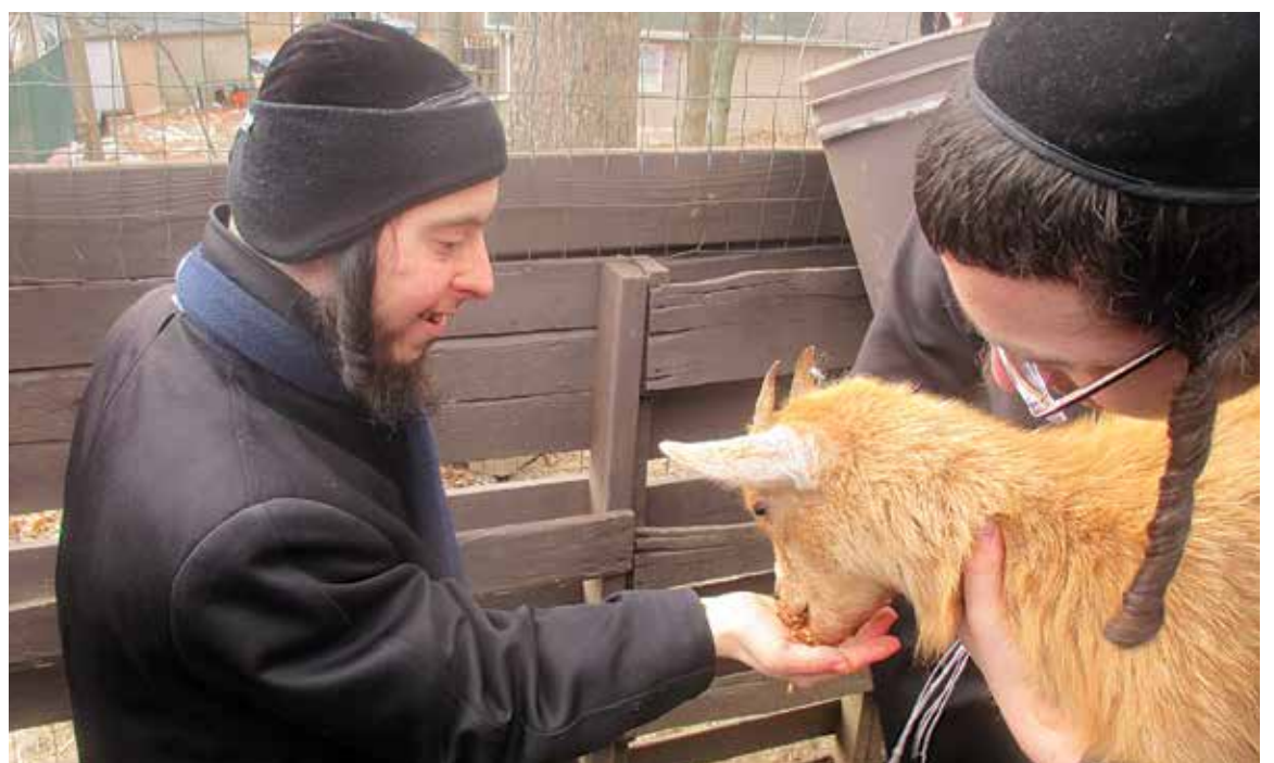
יבואו טהורים ויתעסקו בטהורים... ביים באזוכן א פארם זיך צו באקענען מיט בעלי חיים צו פארשטיין בעסער די ויקרא סדרות