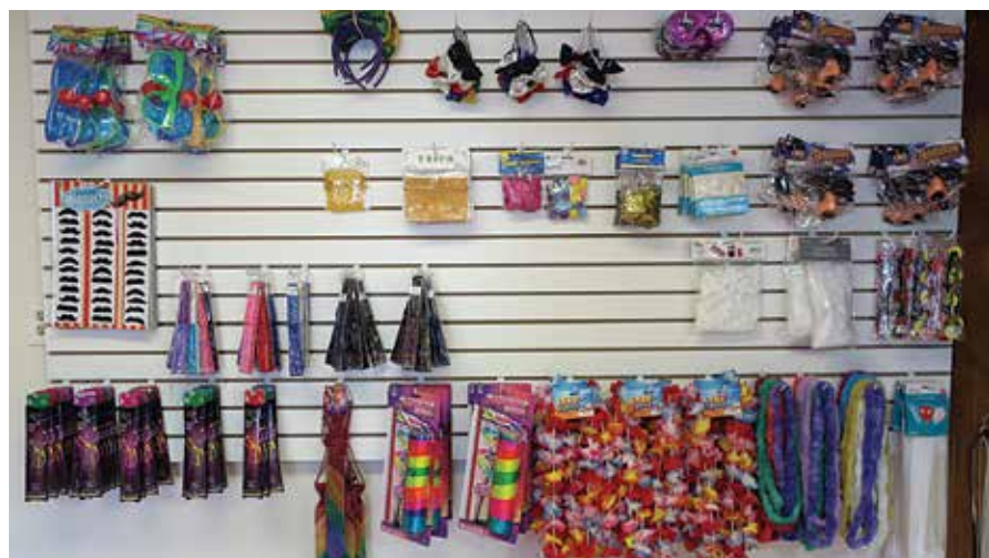
טייל פונעם קאלירפולן אויסוואל