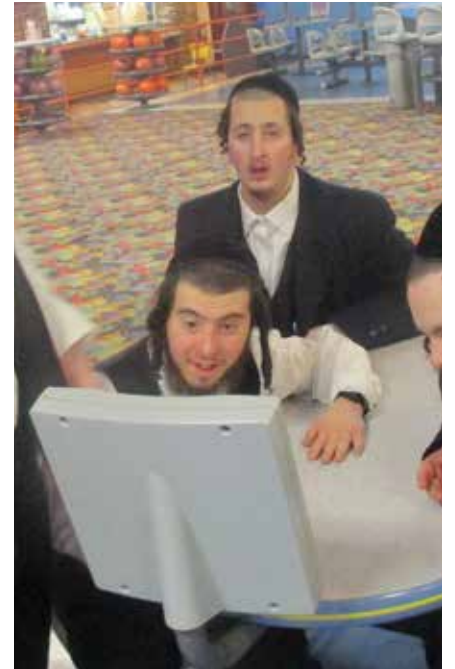
ביין אן אויספלוג