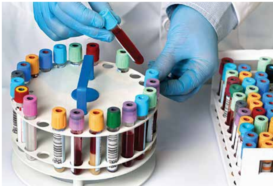
הונדערטער זענען אריינגענארט געווארן אינעם "בלוט שווינדל"

קאליפארניע וועלכע פארקויפט א ליטער פון יונגע בלוט פאר ארום אכט טויזנט דאלער, און פירט דורך די איינשפריצן אין פינף לאקאלן איבער די פאראייניגטע שטאטן, און אין די לעצטע צייט איז די פאפולאריטעט פון די סארט באהאנדלונג שטארק געשטיגן. אבער א ווארונג פון די אמעריקאנער עף-די-עי אנגעטור ווארנט דערקעגן. אינעם סטעיטמענט שרייבן זיי אז די וועלכע טראגן אן די סארט באהאנדלונג פארשפרייטן פארפירענישע אינפארמאציע, און אז עס איז נישטא קיין שום שטודיע אדער ערנסטע מעדיצינישע אויטאריטעט וועלכע שטיצט אונטער דעם באהויפטונג אז יונגערע בלוט איז עפעקטיוו אין פארמיידן אדער היילן סיי וועלכע מחלות.