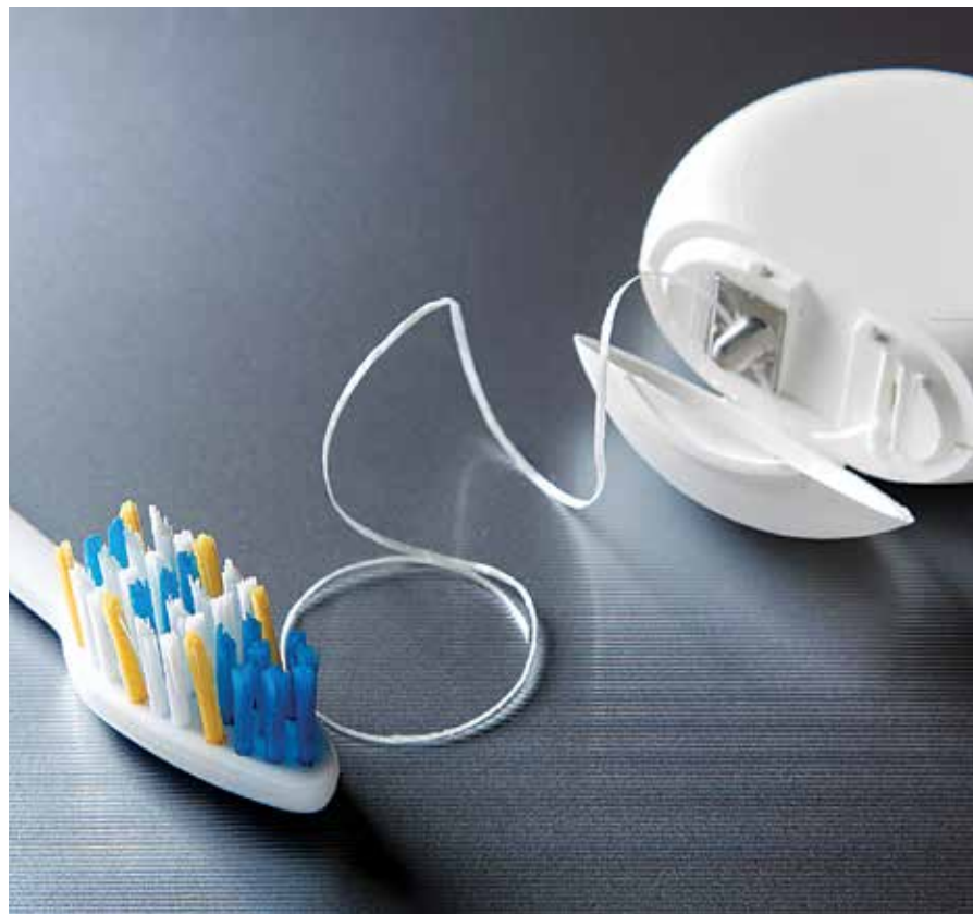
"איר דארפט ניישט טוישן אייערע פלאס געוואוינהייטן" זאגן עקספערטן

און איז אינדארסירט געווארן דורך געוויסע פראמינענטע דאקטוירים, אבער פון די אנדערע זייט האבן פילע פראמינענטע דאקטוירים באשולדיגט אז די רעזולטאטן זענען זייער רוי און אז מאכט אן אומזיסטע פאניק, און רעקאמענדירן די וועלכע נוצן די סארט פלאס צו זיך ווייטער באנוצן דערמיט אן קיין זארג. ★