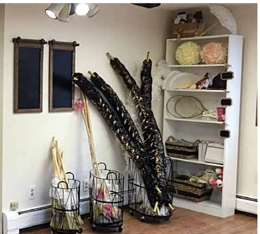
אינעם לאקאל שטייט גרייט א ברייטע אויסוואל פון האנט ארבעט פון די טייערע מיידלעך צו באשיינען דעם שמחה