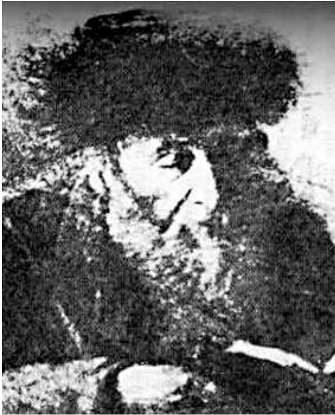
דער בילד וואס איז מיזחוס צו הגה"ק מצאנו צו"קל