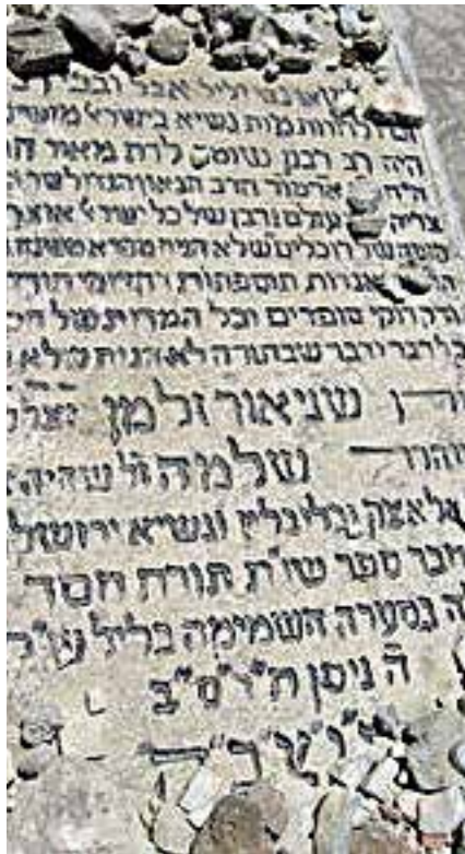
מקום מנוחתו פונעם לובלינער רב אויפ'ן הר הזיתים

ווען דער גאון איז געליגן שוואך אין בעט און אידן זענען געקומען זיך מזכיר זיין מיט קוויטלעך.