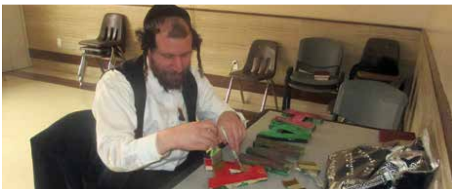
ביים עוסק זיין אין "בדק הבית" און ערצייגן א הערליכע שילד פאר'ן ישיבה