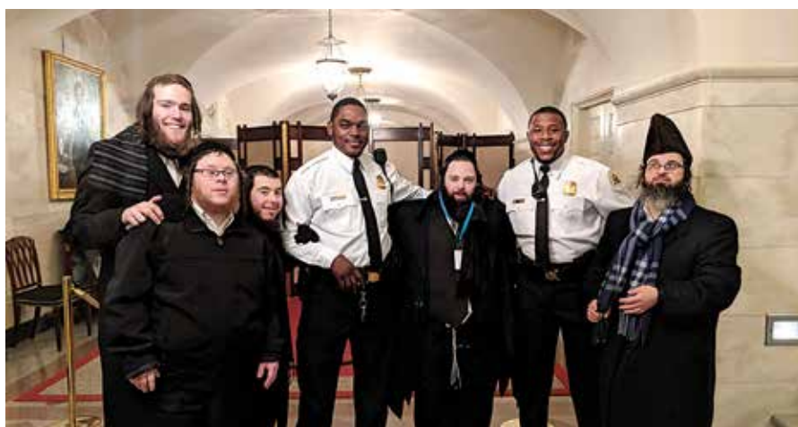
בחדר בית המלכות די תלמידים אין די קארידארן פון ווייסן הויז

דער באזוך איז געקומען הארט נאך א רעגירונג שאטדאון וועלכע האט צושטערט די טאג טעגליכע סדר היום אין וואשינגטאן, און עס האט נישט אויסגעזען אז מען וועט קענען