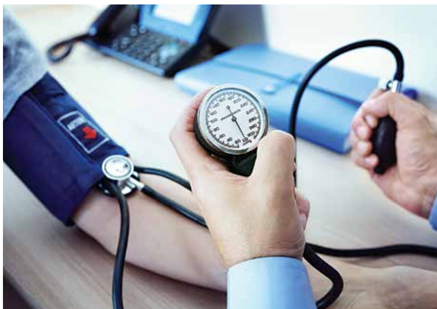
מיליאנען זענען עפעקטירט געווארן פונעם בלוט-דרוק טאבלעטן מאסיוון ריקאל

דערווייל האלט מען נאך אינמיטן דערגיין וואו דער פראבלעם האט זיך אנגעהויבן, און באאמטע זאגן אז עס איז מעגליך אז אין לויף פון דעם אויספארשונג וועלן זיי ארויסגעבן פרישע ריקאלס אויף נאך מעדיציןען וועלכע זענען מעגליך עפעקטירט געווארן פון דעם פעלערהאפטע סיסטעם, און פארשערען צו איינפירן פרישע זיכערהייטס סטאנדארטן צו פארזיכערן אז דאס פאסירט נישט אים די צוקונפט. ★