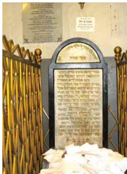
דער מצבה פון די בעל דברי חיים אין צאנז