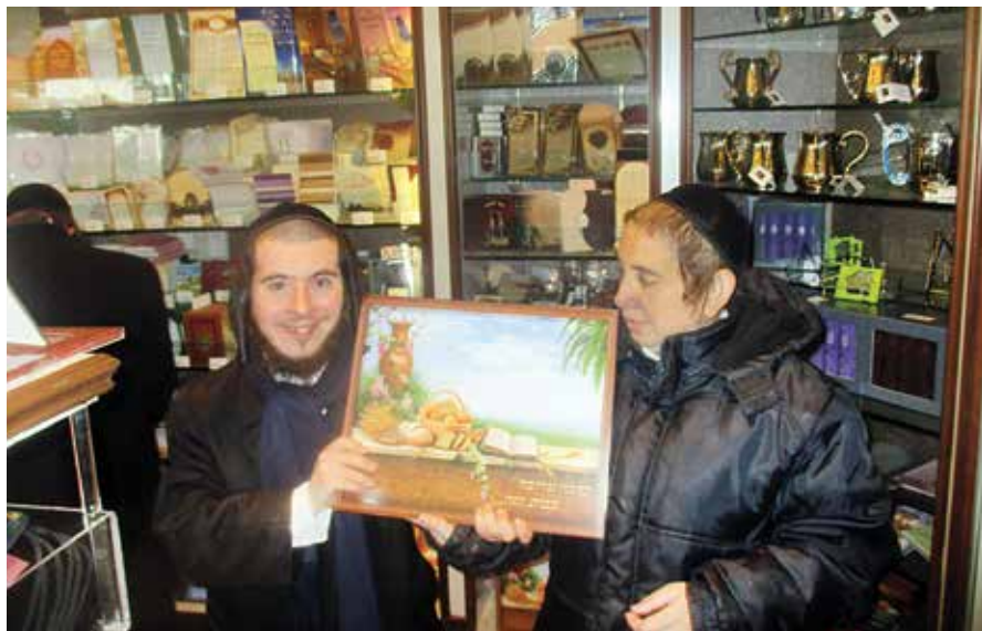
ביים זיך איינהאנדלן מתנות אינעם "מפואר" געשעפט